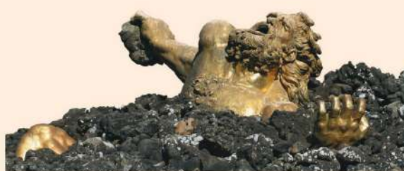
Bosquet d'Encelade, sculpture en plomb, Gaspard Marsy, 1675-1677, parc du château de Versailles.

Apollodore, La Bibliothèque, Livre I, chapitre 6