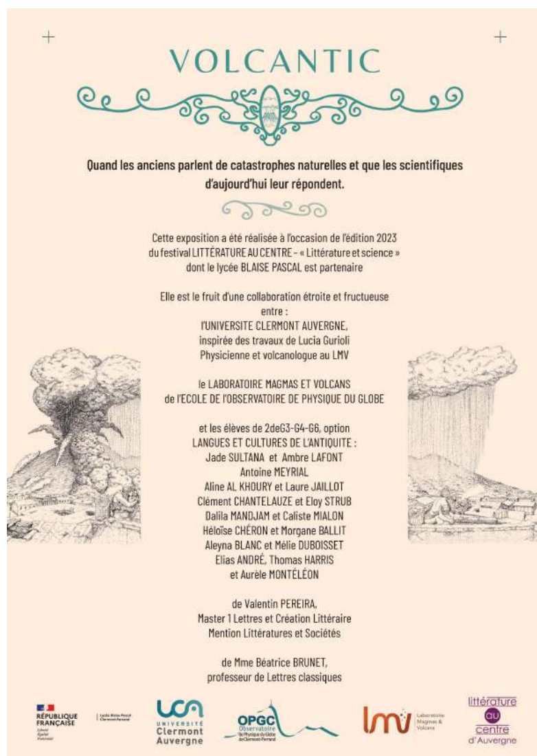
Panneau d'introduction de l'exposition

L'exposition se compose de 12 panneaux en plexiglass au format A1.