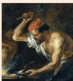
Peinture de RUBENS, Hephæstos forgeant le foudre de Zeus, 1636-1638, musée du Prado.